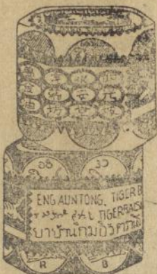
Dalem goetji ketjil merah dan poeti

Obat tjap Matjan fida boleh tida ada di toean poenja roemah, kerna tida ada obat lebih baek boeat semboehken Rheumatiek, sakit boekoe toelang dan spier, kasaleo dan pilek dari pada ini obat oemoem. Djoega boeat laen-liden penjakit dan ganggoean obat tjap Matjan ada mandjoer. Tjoba soeroe toean poenja boedjang beli boeat satalen satoe goetji ketjil Obat Matjan. Toean pasti aken dapet kafaedahan dari ini.